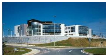
TECNALIA Donostia eta Zamudio