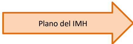
Plano del IMH

En la Escuela hay parking para poder aparcar en los puntos que se indican. En caso de no haber sitio, se puede aparcar sin problema en los alrededores. No hay OTA.